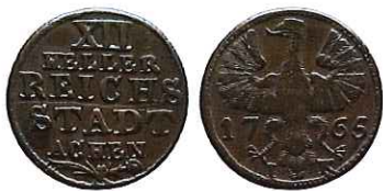
22 — Munt van 12 heller van Aken, geslagen in 1765. [Geldmuseum Utrecht, inv.nr. BM-o8o68]

Wanneer we bekijken met welk geld de Maaseiker winkelier zijn leveranciers in Duitse gewesten betaalde, dan ontstaat een beeld dat min of meer vergelijkbaar is met de betalingen aan leveranciers in de Zuidelijke Nederlanden. Wederom vormden Franse ecu's de standaardmunt in het betalingsverkeer, maar vanwege een gebrek aan dergelijk muntgeld fungeerden in papieren rolletjes verpakte munten van koper of biljoen (laagwaardig zilver) als surrogaat zilvergeld. Dit laagwaardige geld stamde nu evenwel niet uit de Zuidelijke Nederlanden maar uit de rijksstad Aken en het hertogdom Gulik. Deze papieren muntvondsten sluiten mooi aan bij de schatvondsten van Sittard en Gelinden, waarbij Akense XII-heller stukken eveneens ruim waren vertegenwoordigd (fig. 22). 27