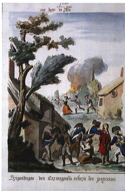
11 — Franse soldaten, ook wel carmagnoles genoemd, zijn aan het plunderen. Aquarel van Goetbloets. [Koninklijke Bibliotheek van België, sign. hs 11 1492]

Eigentijdse documenten bevestigen deze gang van zaken. De Weertse kroniekschrijver Lambertus Gooffers beschreef hoe Franse militairen huishielden bij hun verovering van de streek (fig. 11). Op 14 september 1794 trokken ze Stramproy binnen, waar het kermis was. Niet alleen staken ze de vlaaien aan hun bajonetten, ze namen ook beurzen vol kronen mee. Daarna vertrokken ze naar het gehucht Tungalroy 'en sy liepen al weeder de huysen af en vroegen al weeder croonen.' Hun plundertocht zetten ze voort in Weert, waarna zij naar Bocholt trokken, 'maer op een quartiers uurs tyd sag men het goud en silver verbannen, want men sag geenens mensch meer met een sak-horologie, met silveren gespen en geen dogter met gouden en silveren kruys-