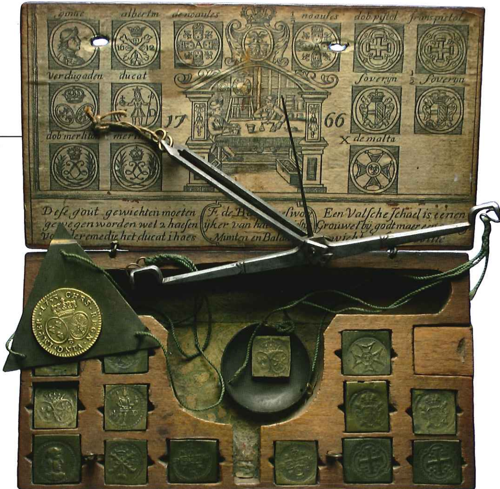
30 — Muntgewichtdoos, in 1766 gemaakt door F. de Batist te Antwerpen [Geldmuseum Utrecht, inv.nr. NV-03375], met op de balans een Franse gouden louis uit 1733: een louis d'or aux lunettes ofwel vertugadin . [Geldmuseum Utrecht, coll. DNB]

ecu's die bij hem waren gestolen te licht waren, terwijl de louis d'or die was ontvreemd nog stempelglans had. 53