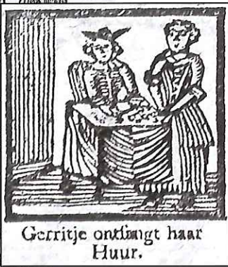
26 - detail

Te DEVENTER, Gedrukt by J. H. DE LANGE, Boekdrukker en Verkooper aan den Brink