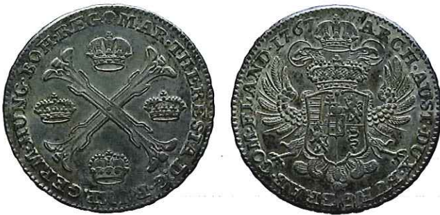
18 — Brabantse kronenthaler uit 1767. [Geldmuseum Utrecht, inv.nr. NM-10211]

De betalingen aan de leveranciers in de Republiek geschieden voornamelijk met groot zilvergeld. Franse ecu's, Brabantse kronen, Zeeuwse rijksdaalders en Hollandse drieguldens en guldens vertegenwoordigden de bulk van de waarde van de transacties. De leveranciers in de Republiek werden overwegend met harde munt betaald. Opmerkelijk in dit verband is het aanzienlijke aantal grote Brabantse zilverstukken: geld dat we in de schatvondsten niet tegenkwamen (fig. 18). De betalingen van de winkeliers wijzen erop, dat dit geld wegvloede naar de Republiek.