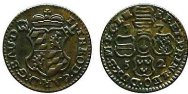
20 — Oord uit Luik uit 1752. [Geldmuseum Utrecht, inv.nr. NM-11067]

ciers in de Zuidelijke Nederlanden op grote schaal met koperen oortjes. Via een moderne vorm van alchemie werd betrekkelijk waardeloos kopergeld omgesmeed tot kostbaar zilvergeld. Dat ging als volgt. Koperen oortjes werden telkens per tachtig stuks verpakt in papier en vormden zo een rolletje – cahot in de destijds gangbare term – met een vaste waarde van 1 gulden Luiks (fig. 20). Kopergeld, dat slechts een beperkte intrinsieke waarde had, kreeg zo de waarde van zilvergeld. Deze rolletjes gingen van hand tot hand en werden niet telkens uitgepakt om het aantal muntjes te tellen. 23