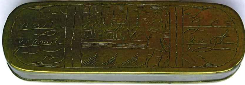
12 — Koperen tabaksdoos uit de achttiende eeuw. Hoogstwaarschijnlijk verstopte boer Pasmans uit Bocholt zijn zilvergeld in deze tabaksdoos. [Particuliere collectie Hasselt (B)]

sen, want sy hadden al horlogiën uyt de sakken gehaelt, en de gespen die naemen sy van de schoenen, en de kruyssen naemen sy de vrouwen uyt den hals.’ 14